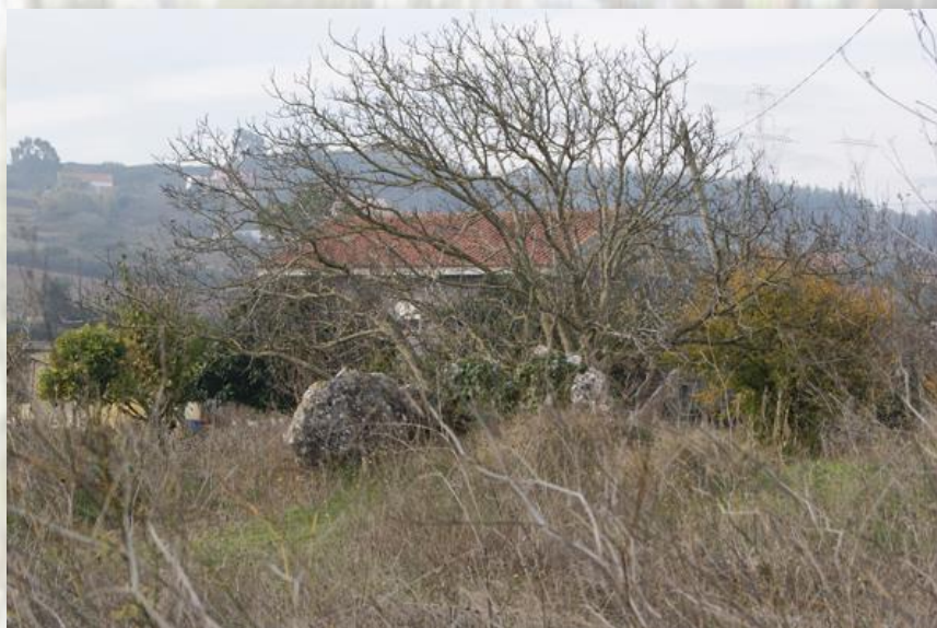
Monumento Megalítico de Casaínhos - CM Loures

Chegados a Ponte de Lousa iremos passar junto à Igreja do Espírito Santo, continuar em direção ao Lagar do Grilo, passar a ribeira de Lousa e subir para o planalto que vai dar ao Alto da Toupeira, local onde se encontram a Anta e a Diáclase de Salemas.