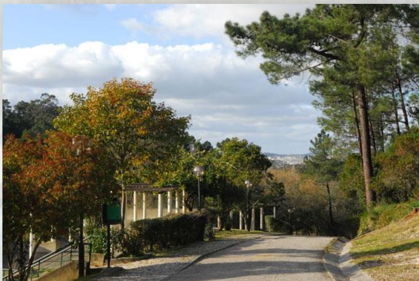
Parque Municipal do Cabeço de Montachique - CM Loures

Após visita à Anta, acompanhada por técnicos da Divisão da Cultura, começaremos a descer para Ponte de Lousa, com passagem por uma plataforma calcária, com os seus grandiosos afloramentos, local escolhido por comunidades da pré-história recente, como atestam os trabalhos arqueológicos já realizados.