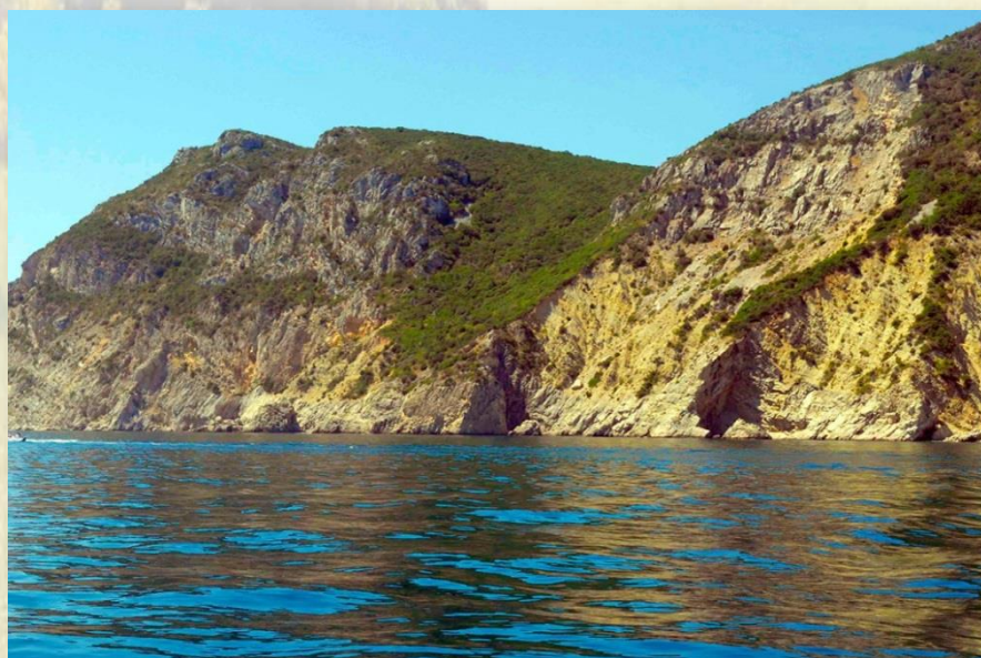
Escarpa calcária da serra do risco

Ao contrário de outros relevos da região, esta elevação não corresponde a uma estrutura em dobra (anticlinal), mas sim a um doma. O seu aspeto distinto, especialmente quando observado de perfil, levou Sebastião da Gama a descrever a Serra do Risco desta forma: «A serra tem o ar de uma onda que avança impetuosa e subitamente estaca e se esculpe no ar; é uma onda de pedra e mato, é o fóssil de uma onda».