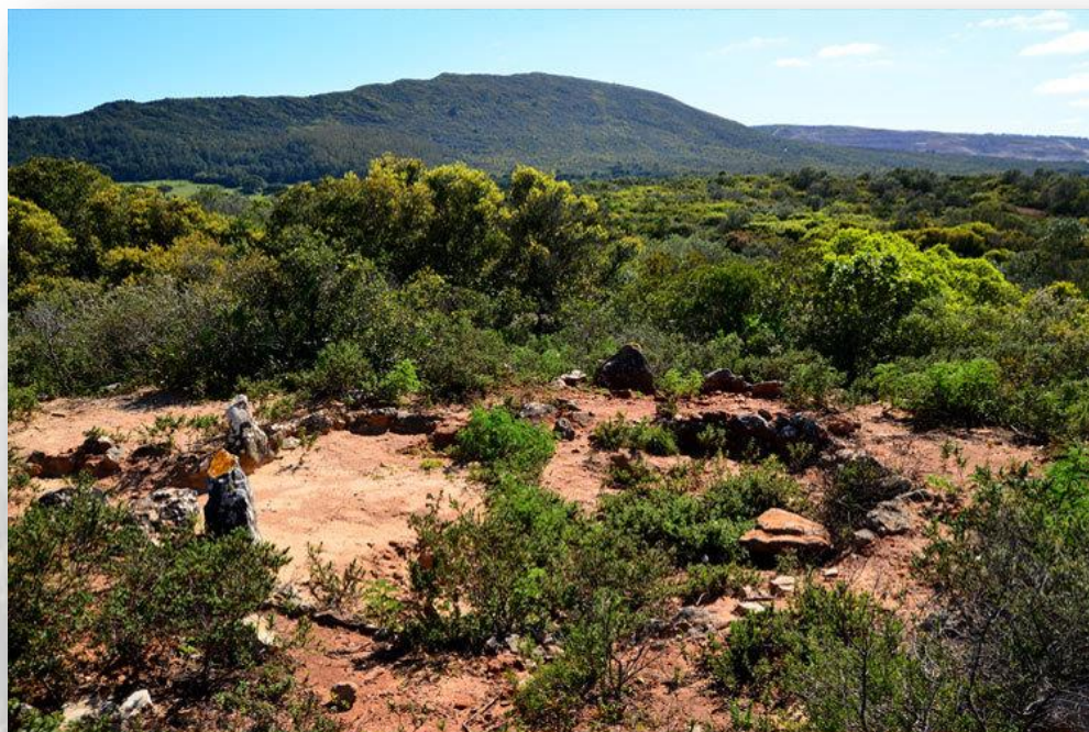
Roça do Casal do Meio – CM Sesimbra

assim uma armadilha mortal para as tropas mouras sediadas no Castelo de Sesimbra. Por outro lado a presença da linha de horizonte da mais alta escarpa calcária sobre o mar no continente português (380 metros no Píncaro, quase a pique até ao mar) apresenta-se como um "risco" perfeito no horizonte.