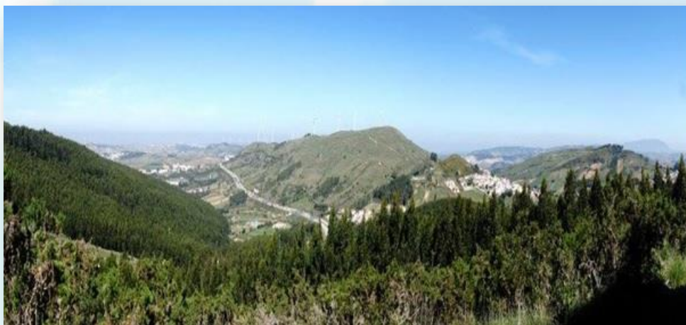
Paisagem Protegida Local das Serras do Socorro e Archeira - ICNF

A Serra do Socorro fica localizada na Freguesia da Enxara do Bispo, no limite de três Concelhos: Mafra, Torres Vedras e Sobral de Monte Agraço. Apresenta uma paisagem dominada por uma intensa ruralidade, sendo que o seu ponto mais alto se