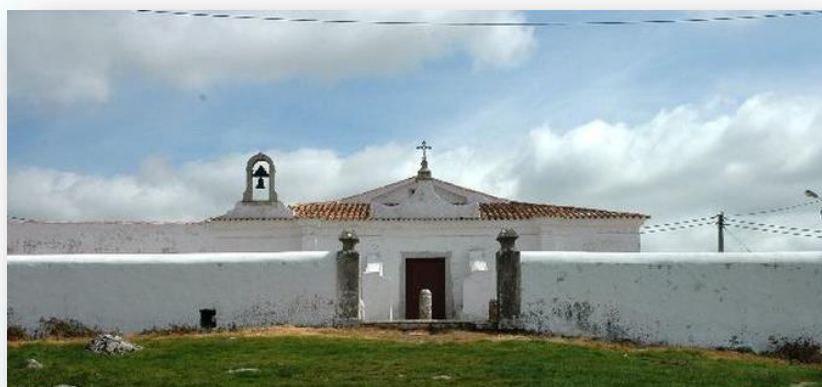
Ermida de Nossa Senhora do Socorro

situa a 395 metros do nível do mar, destacando-se como um excelente miradouro natural. O percurso deste passeio desenrola-se, por isso, numa zona muito acidentada em termos de relevo, o que lhe confere uma dificuldade acrescida. Destaque natural, nas dificuldades a vencer, para a subida final até ao topo da serra. Como passeio noturno que é, aconselha-se que os participantes venham munidos de uma pequena lanterna, de forma a vencerem com mais facilidade os locais mais escuros e os terrenos mais instáveis.