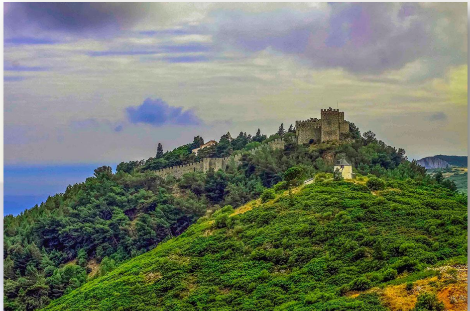
Castelo de Sesimbra - CM Sesimbra

O percurso “Rota de Cezimbra” é um trajeto de carácter urbano e periurbano, que tem como objectivo dar a conhecer o património histórico-cultural, natural e paisagístico do concelho de Sesimbra, nomeadamente desta bela cidade ladeada pelo Parque Natural da Arrábida. O percurso tem pouco mais de 5km, é de dificuldade baixa e de tipologia linear. A realização do percurso é aconselhada durante todo o período anual.