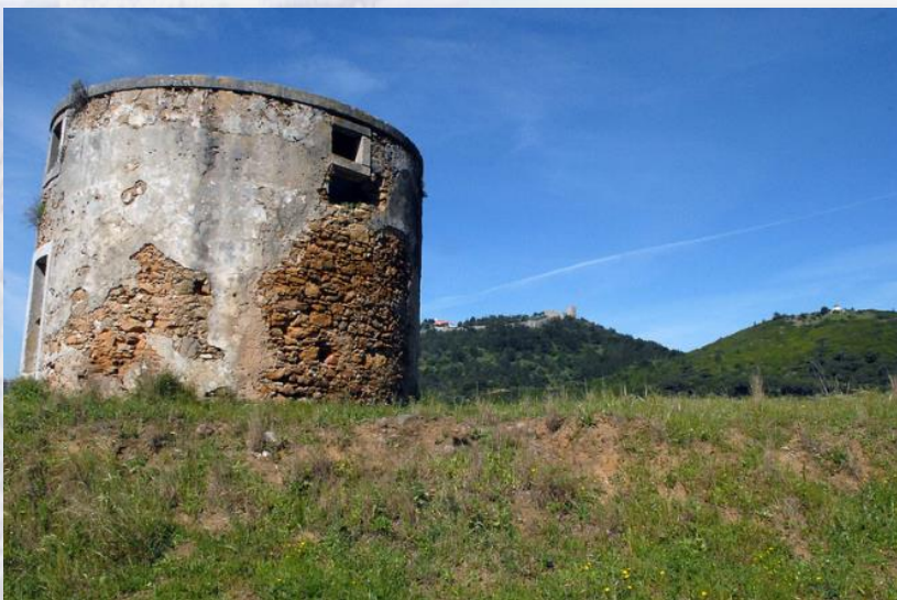
Moinho dos Sete Caminhos com o Castelo ao fundo

Inicia-se no Castelo e desce pelos antigos caminhos até à vila, sempre com o mar em fundo, oferecendo vistas fantásticas sobre toda a costa. Em Sesimbra passa pela Capela do Espírito Santo dos Mareantes, Paços do Concelho, Rua da República e o Largo do Município, onde se localiza o antigo pelourinho, pontos de interesse marcantes do ponto de vista histórico e arquitectónico.