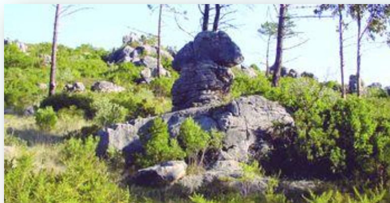
Lapiás no PNSAC - ICNF

Desenvolve-se na sua quase totalidade por caminhos e pequenos trilhos de