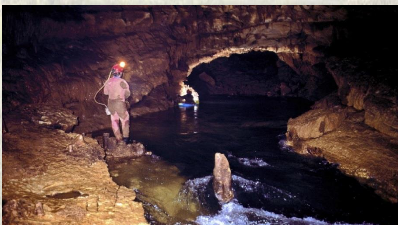
Gruta do rio Almonda - Portal de Turismo do Médio Tejo

Aconselhada a utilização de botas de caminhada.