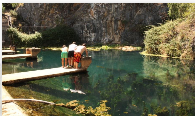
Nascente do rio Almonda - mediatejo.net

caminhada. Este é um percurso de dificuldade média/elevada, pelo que alguns locais podem ser de difícil progressão, pelo que se exige uma preparação física adequada para a realização do mesmo.