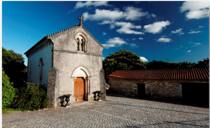
Casal Farto – CM VN Ourém

O percurso tem início junto ao Monumento Natural das Pegadas de Dinossáurios da Serra de Aire. Atravessando a estrada alcatroada e vencendo perpendicularmente o declive que culmina nos 360 m de altitude, chega-se à lagoa e parque de merendas, local bastante aprazível, donde se alcança uma vista panorâmica que extravasa os limites do Parque Natural, a norte, deixando para trás a povoação do Bairro, que, no regresso, terá oportunidade de visitar mais detalhadamente.