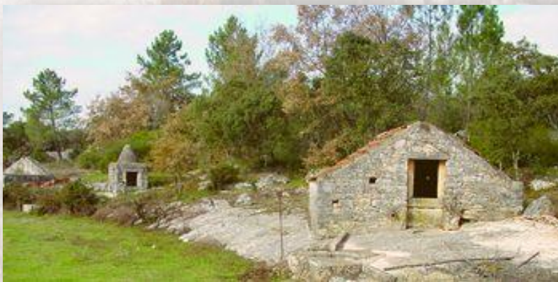
Cisternas - ICNF

Vale de Cavalos e, especialmente, a Rua das Flores merecem um olhar especial, pois trata-se de um conjunto de casas construídas em pedra, notável não só pela sua arquitetura tradicional mas também pelo seu colorido enquadramento.