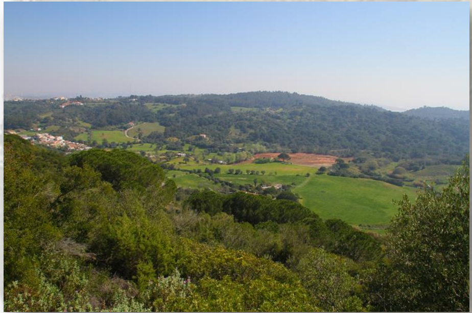
Vale de Alcube – CM Palmela

Passe a ponte e do seu lado esquerdo ficará a Ribeira de Alcube. Emoldurada por árvores centenárias, esta ribeira segue pela vertente oeste da Serra de São Luís em direcção à Comenda e desagua na praia com o mesmo nome.