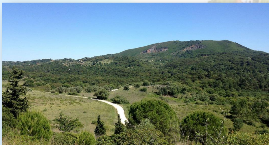
Serra de S. Luís - CM Palmela

Após a ponte, deve continuar-se e virar imediatamente à esquerda para percorrer um caminho paralelo à Quinta de Alcube, em direcção à Quinta do Rego de Água.